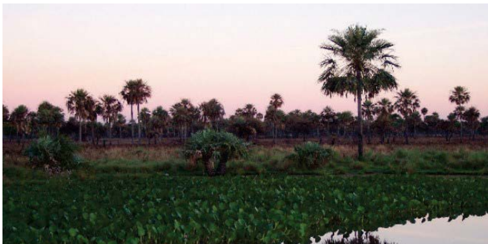
FIGURA 3. Paisaje del Chaco paraguayo.