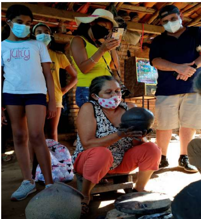
IMAGEN 4 Maestra alfarera en Tobatí haciendo demostraciones en vivo a los participantes.

experiencia de La Ruta del Barro, sirvió para que ambas comunidades mejoren la calidad de sus piezas en donde faltase y, también, dio empuje a recuperar piezas autóctonas de nuestros utensilios utilitarios tradicionales que ya dejaron de hacerse por falta de demanda.