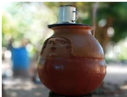
IMAGEN 10 Y 11

KAMBUCHI Chola estilo tradicional iteño y Tinaja tradicional del estilo tobateño con rostro femenino elaborado por las mujeres alfareras de San Rafael.