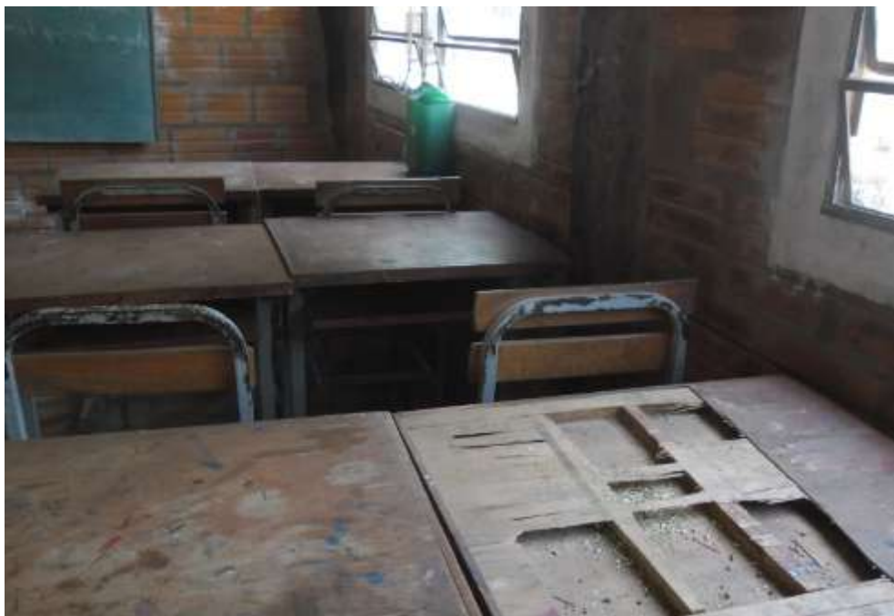
FIGURA 2 La Escuela Básica sin equipos informáticos