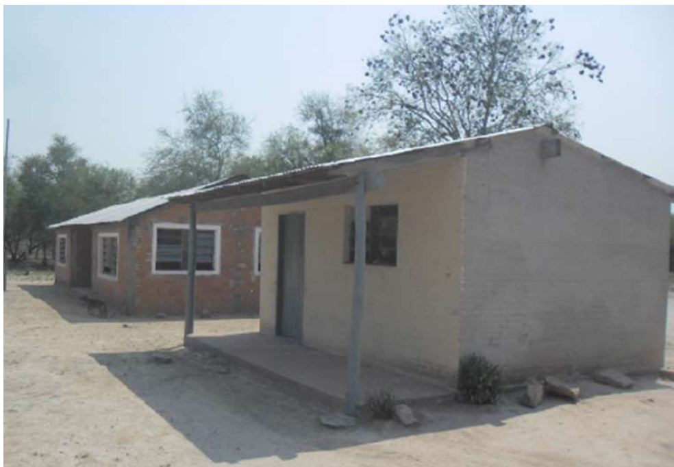
FIGURA 2 La Escuela Básica N°4765 de la comunidad indígena La Promesa .